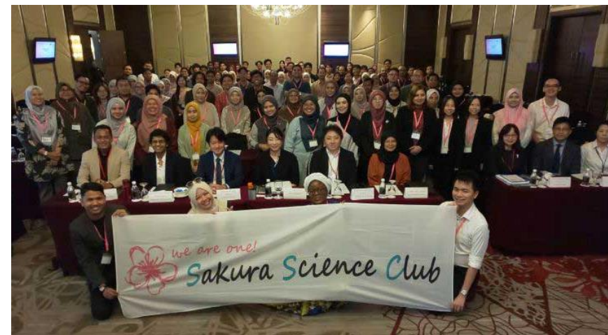
マレーシア同窓会(2025年11月)