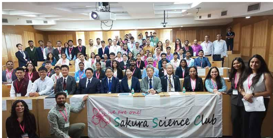
インド同窓会(2025年10月)

本プログラム参加者は、修了時に本事業の同窓会組織である「 さくらサイエンスクラブ 」のメンバーとして認定され、修了証が発行されます。メンバーが継続的に日本と相手国・地域との架け橋となり、活躍していただくために役立つ情報をウェブサイトで提供し、各地で開催する同窓会情報もご案内しています。