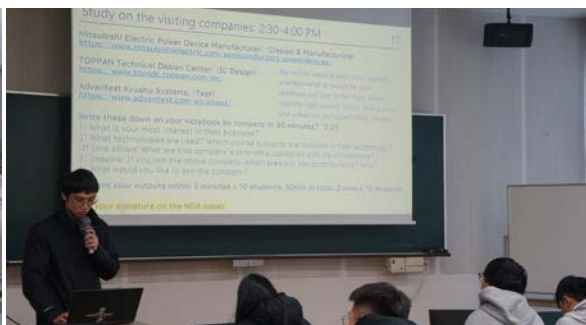
見学企業を事前に研究し、企業の特徴と質問したい内容を発表

〈企業見学〉三菱電機パワーデバイス製作所ではパワー半導体を用いた電気自動車用インバータの設計・組立・製品テスト工程、つまり熊本で行っている半導体ウエハー製造以外のすべての工程を見学先の事業所で実施していることを知りました。ウエハープロセスは動画での説明になりましたが、インバータのパワーモジュールの製造工程は通路から見学させていただきました。パワーモジュールの設計チームのリーダーは台北科技大で博士号を取得した方で、直接後輩たちに説明いただき、学生らは先輩が活躍している様子を知ることができたことを大変喜んでいました。 TOPPANテクニカル・デザインセンターでは「ターンキー・ビジネス」という新しいビジネスモデルを学びました。顧客から集