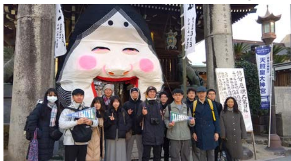
企業訪問の帰りに、IPS学生と一緒に櫛田神社を参拝