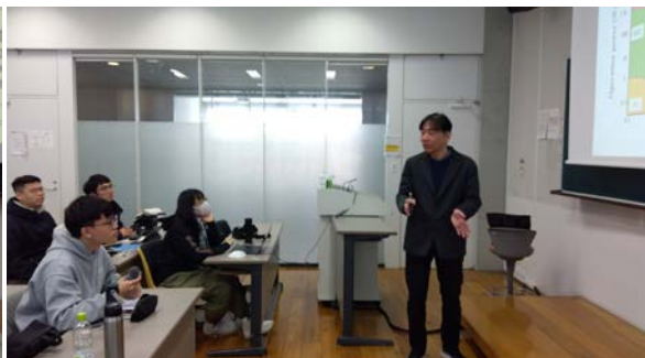
招へい学生が福岡訪問前に調べた内容をベースに講義内容について質問