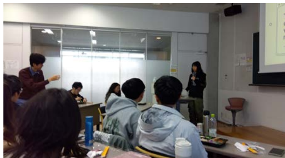
招へい学生の自己紹介に対して、早稲田IPS学生④が質問