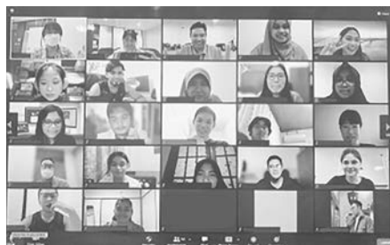
図1:研究ワークショップ

1. 研究ワークショップ…医学医療系の11研究室が参加し、オンデマンド型のビデオ講義として、①教員は自身のキャリアや研究科学者を目指した経緯②各研究分野のトレンドや問題点③自身の研究目的と目標④を紹介した。参加者は講義を視聴した後、教員からの課題に回答し、後日研究室のメンバークラスの研究の詳細についてのライブディスカッションに参加した(図1)。オンデマンド講義には