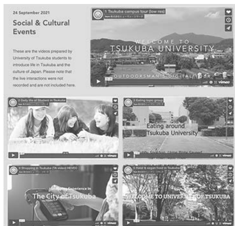
図2:学生交流イベント

本プログラムの参加者は筑波大学の協定校を中心に、全世界から大学HPやSNSを通じて300名を超える応募があった。最終的には13カ国から187名の学生が参加した。プログラム後のアンケート調査では、高い満足度とともに、研究について高い関心が示された。また、学生交流イベントでは、奨学金や研究室、ならびに日本での生活について関心が高く、本学学生と積極的に討論を行った。今回のさくらサイエンスプログラムでは、医学研究への情熱を惹起し、将来研究者として科学イノベーションの創出と社会への還元に貢献できる人材育成の手助けとなり、また日本への優秀な学生の勧誘に寄与したプログラムであったと考える。