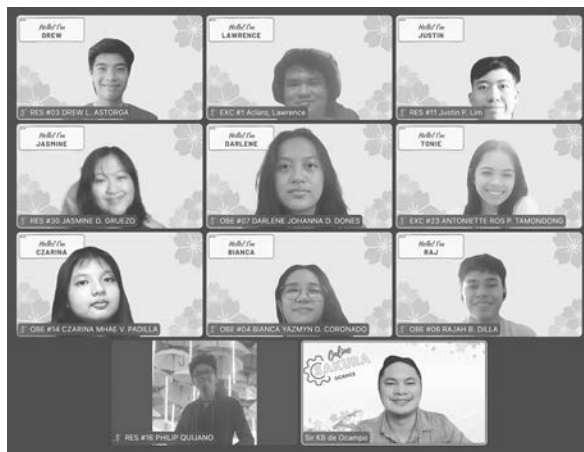
参加したフィリピンの生徒と先生ら