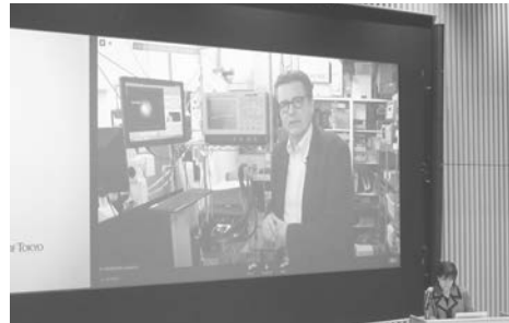
ウッドワード教授:研究室からのライブ中継