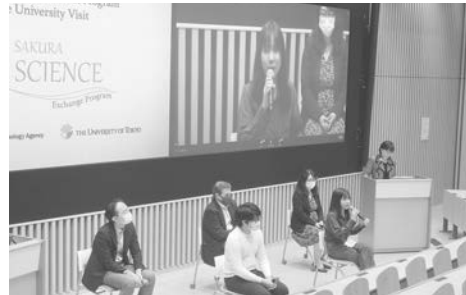
全体Q & A