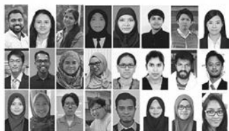
発表した学生さんたち