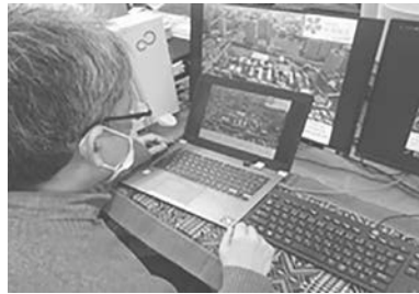
東京海洋大学の紹介