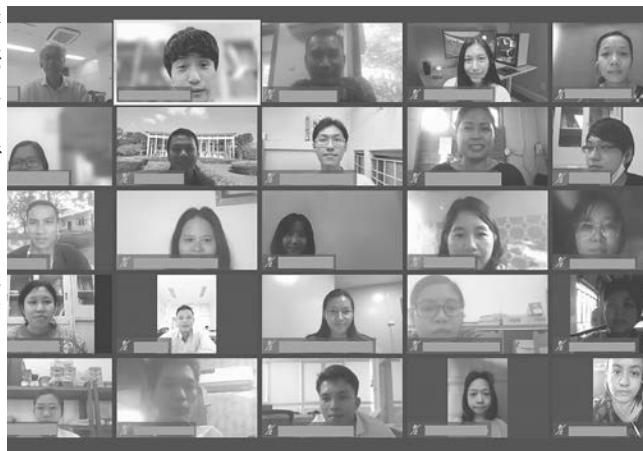
参加者のスクリーンショット

受け入れ教員は、上記2大学を対象に行われた国際協力機構(JICA)支援の「ミャンマー工学教育拡充プロジェクト」の中で教育・研究支援を行って参りました。COVID-19蔓延や国内情勢の混乱のため第二期支援プロジェクトが中止となり、現地学生や教員からはさくらサイエンス事業による交流への期待が強くなっています。また千葉大学において学生への留学が必須となるなど国際交流が強く求められています。本事業は双方からの期待に応えるプロジェクトとして位置づけられています。今年度の交流では、ヤンゴン工科大学で導入されたフーリエ変換型赤外分光高度計(FTR)、真空蒸着装置、マスクアライナー、走査型電子顕微鏡(SEM)を有機的に関連させた研究を若手教員や