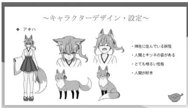
神戸電子専門学校「夏空の夜君の隣」

本来は河北外国语学院の学生たちを招へいる予定でしたが、コロナの収束の目途が立っていないため、オンライン形式での実施に至りました。交流会には本校デジタルアニメ学科の学生10名と、河北外国语学院の学生10名が参加し、その他今回の交流テーマに興味を持って複数の学生も見学者として加わり