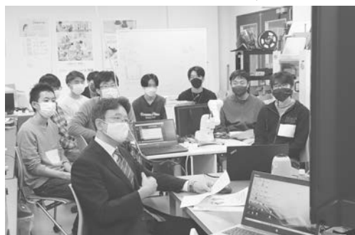
聴講する学生と森校長(写真手前)

コロナ禍で海外渡航が制限される中、学生に国際交流の場が提供できたこと、協定校との友好を深めることができたことは、両校にとっても学生にとっても有意義な機会となりました。これからの相互交流についての議論も、より詳細まで踏み込むことができ、具体的に幅広い交流に向けて貴重な協議の場となりました。