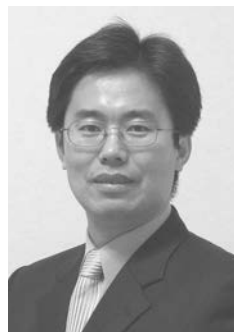
金 帝 演 門 学 校 (鶴岡工業高等専門学校 創造工学科情報コース 国際交流支援室長)