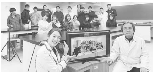
東京理科大学川村研究室 @ゼミオンライン

2021年11月29日より12月3日まで、東京理科大学理学研究科科学教育専攻・川村研究室では、中華人民共和国山東省に立地する曲阜師範大学所属の学部・修士学生15名を招へいし、オンラインで「さくらサイエンスプログラム」を実施しました。